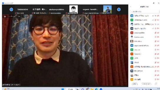
【地域づくりステップアップ講座の様子 1】

地域づくりの実践者がクラウドファンディングに挑戦する際の注意点やコツ、活用事例について紹介していただきました。「クラウドファンディングの成否は金額の大小ではない」「お金が欲しかったらやめた方がいい」等、多くの事例を支援してきた経験ゆえの視点でアドバイスをいただきました。参加者からは「自分の活動ではクラウドファンディングは向いていないと思っていたが、新しいヒントが得られた」「自分たちの活動について講師に相談したい」等の感想が聞かれ、今後の活動に繋がる学びの機会となりました。