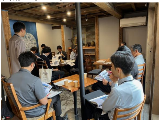
【et cetera.での事前説明の様子】

まち歩きの最後には、これまた同プロジェクトが携わったイタリアンレストランでランチ交流会を開催しました。お互いの活動や地域づくりに対する思いについて活発な意見交換が行われ、有意義な交流ができました。