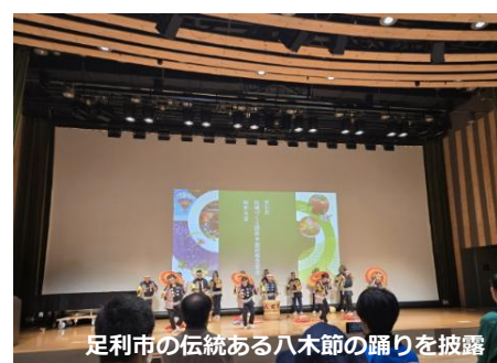
足利市の伝統ある八木節の踊りを披露