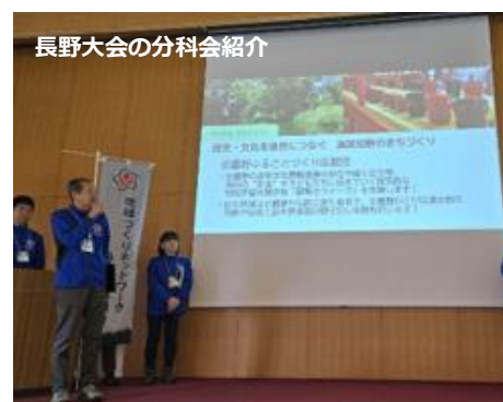
長野大会の分科会紹介