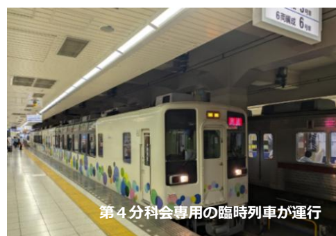
第4分科会専用の臨時列車が運行