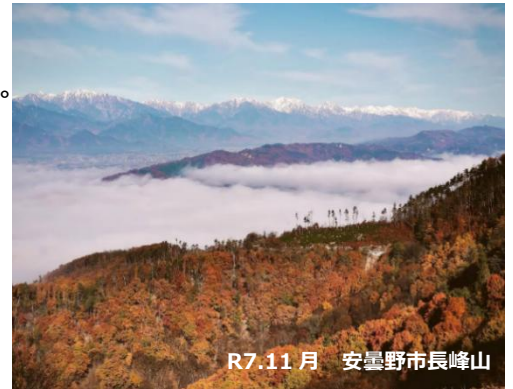
R7.11月 安曇野市長峰山

短かった秋も終わり、すっかりお正月準備の季節となりました。年が明けると、いよいよ本協議会が主催する「地域づくり団体全国研修交流会」長野大会に向けて準備が本格化します。まずは2月に上田市で開催予定のプレ長野大会に向けて、着々と準備を進めていきましょう。本号では、今年11月に開催された栃木大会の様子をご報告します！