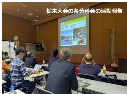
栃木大会の各分科会の活動報告

また、長野大会をPRする時間をいただき、令和8年度の長野大会の紹介や、最後は参加者全員で「信濃の国」を歌い長野大会のPRを行いました。