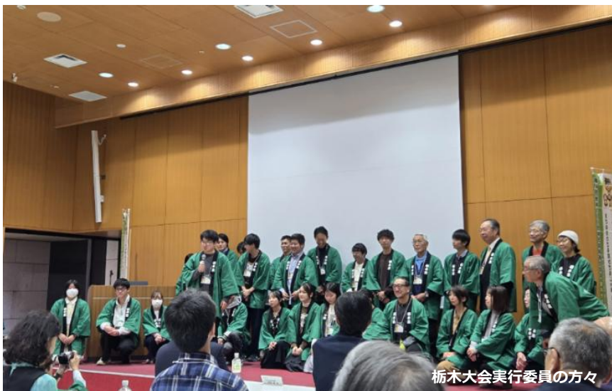
栃木大会実行委員の方々

令和7年11月7日～9日の「第41回地域づくり団体全国研修交流会 栃木大会 見ざる言わざる聞かざるじゃあもったいねえ！～こでらんねえ 栃木県～」に、長野県から実行委員会関係者など12名が参加しました。