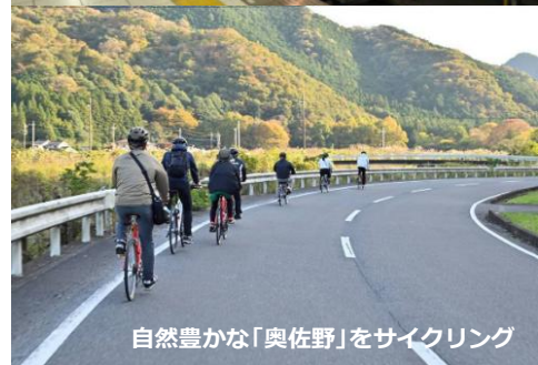
自然豊かな「奥佐野」をサイクリング