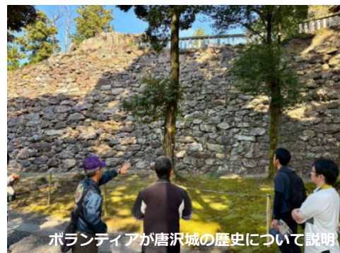
ボランティアが唐沢城の歴史について説明