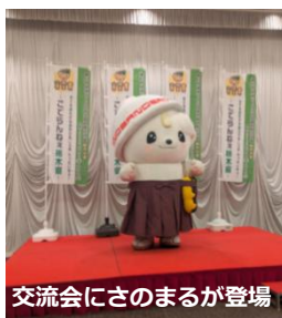
交流会にさのまるが登場