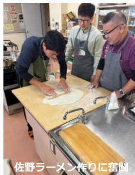
佐野ラーメン作りに奮闘