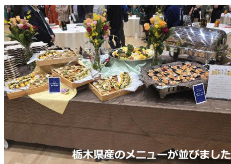
栃木県産のメニューが並びました