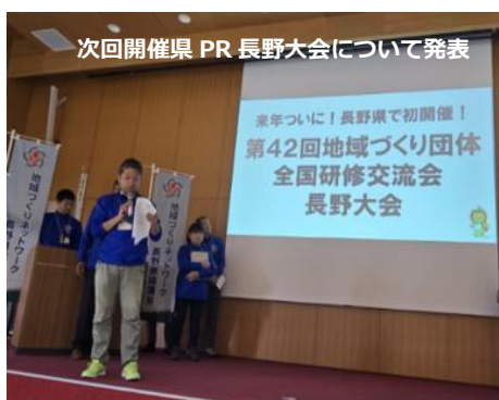
次回開催県 PR 長野大会について発表