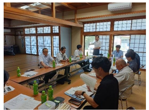
【柿野沢地区意見交換】