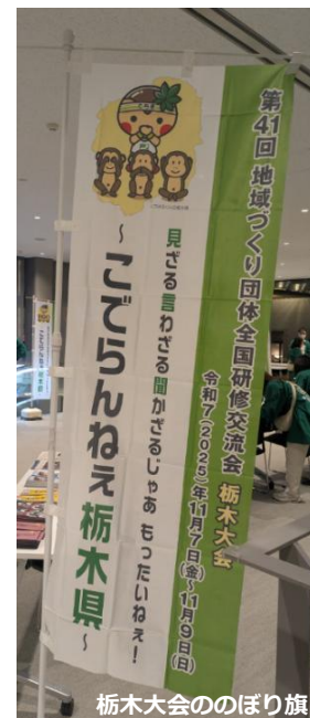
栃木大会ののぼり旗

栃木県内の13会場において、個性あふれる地域づくり活動の体験や、地域の方々や全国から